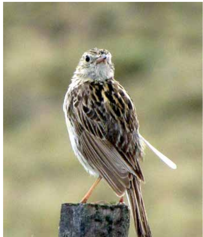
Figura 2. Individuos de Bailarín chico argentino ( Anthus hellmayri dabbenei ) registrados el 21 de enero 2012 cerca del Monumento Natural Dos Lagunas, Coyhaique Alto, región de Aysén.